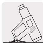
Soporte de descanso